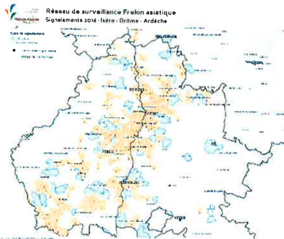
Carte 1 : carte représentative des signalements confirmés de frelon asiatique (nids et individus) sur les départements de l'Ardèche, la Drôme et l'Isère

En 2015 et 2016, le climat lui a été très favorable, ce qui lui a permis de coloniser de nouvelles zones géographiques et de se développer sur sa zone de présence connue (voir Carte 1) :