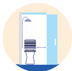
→ Douche de plain-pied