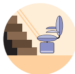
→ Monte-escalier électrique