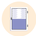
→ Volets roulants électriques